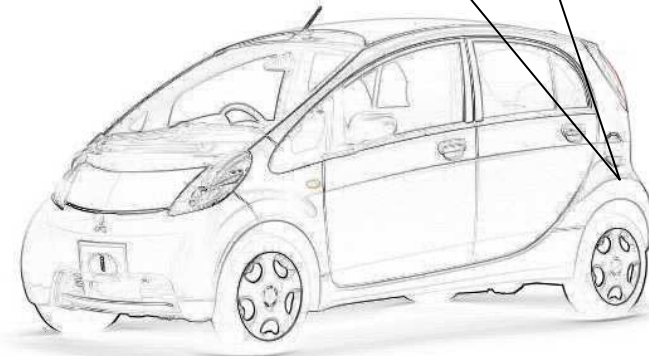
Elektrofahrzeug 47 kw / 1080 kg

Gewicht der Luft berechnet auf Grund des stöchiometrischen Verhältnisses von 14,7, das heisst zur vollständigen Verbrennung von 1 kg Benzin braucht es 14,7 kg Luft